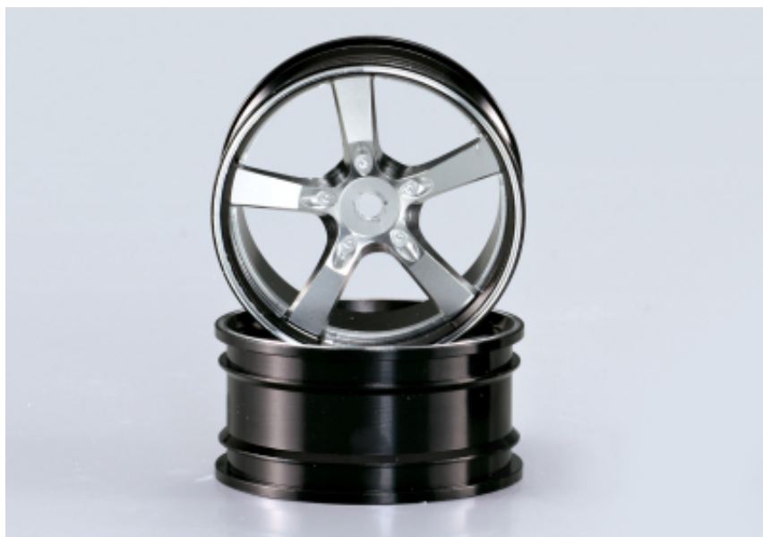
KB48079 - Cerchio in alluminio CNC "Alloy"