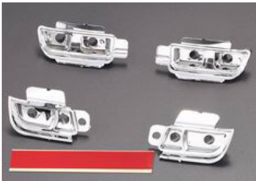
KB48190 - Porta LED