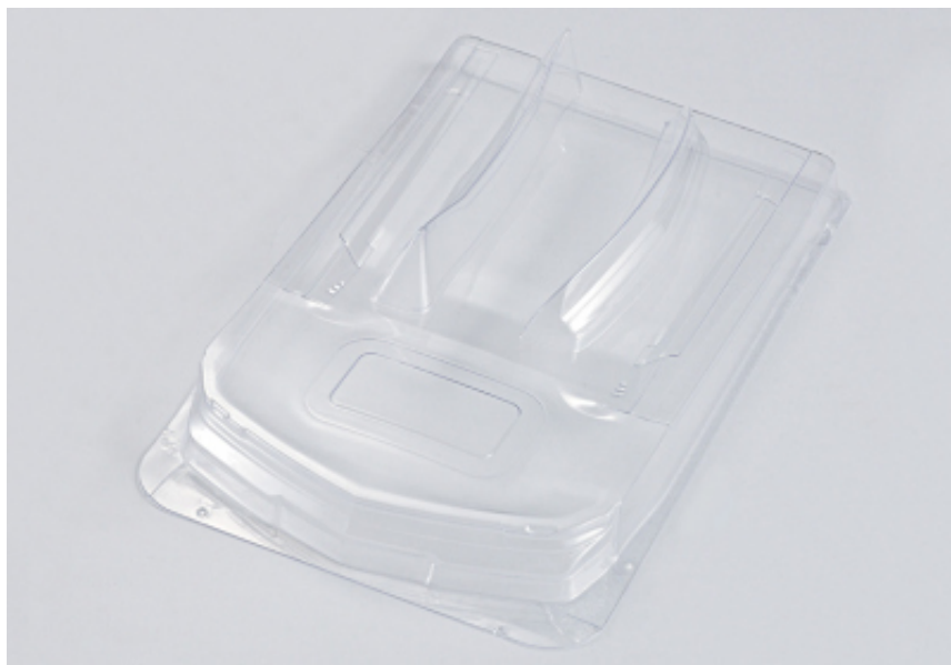
KB48030 - Body Kit