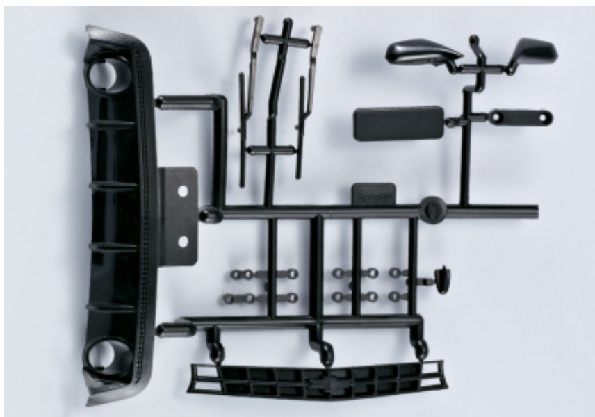
KB48032 - Accessori in plastica