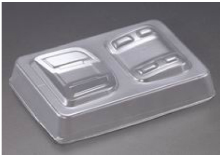
KB48117 - Fanali trasparenti