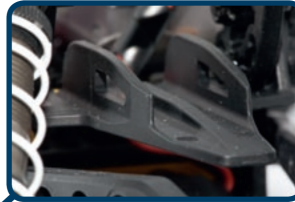
Zwischen den Upper-Links sitzt die Halterung für den LiPo