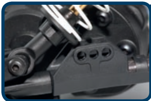
Die Dämpferaufnahmen auf den unteren Links lassen drei Positionen zu