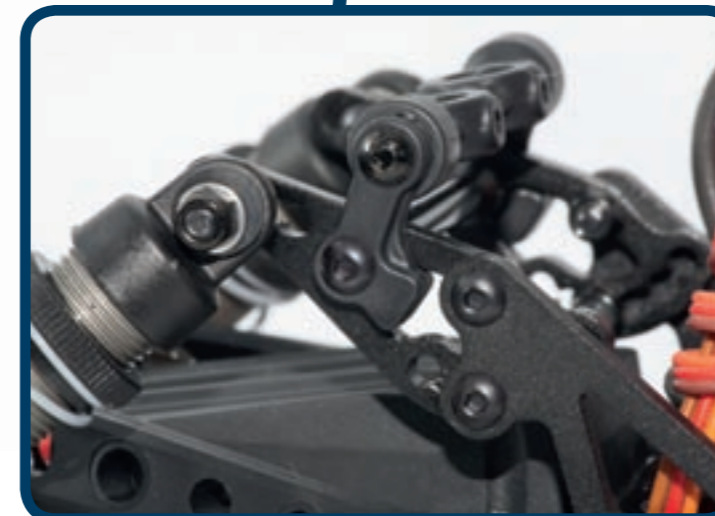
Die verstellbaren Dämpferaufnahmen lassen viel Spielraum für individuelle Einstellungen