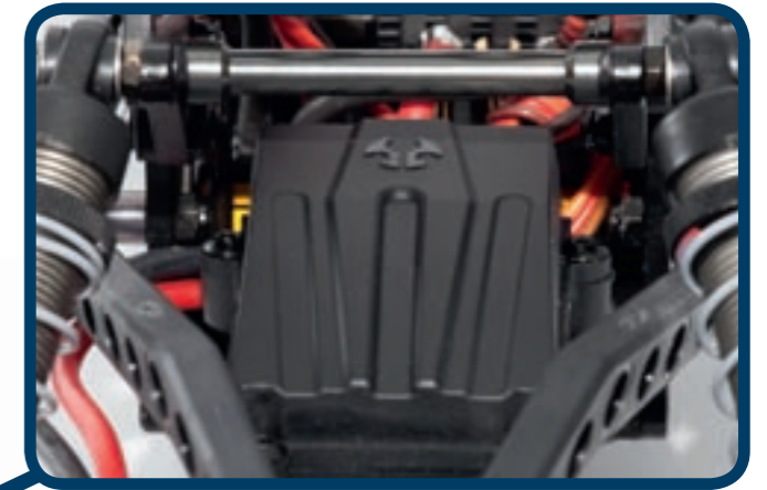
Eine RC-Box sitzt zwischen den hinteren Upper-Links