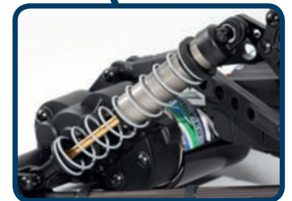
Die mit Öl befüllten Dämpfer sind aus Aluminium