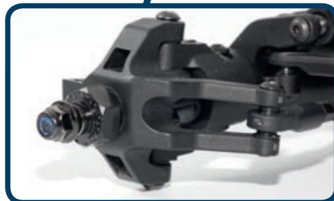
Der Knuckle mit der BTA-Lenkung