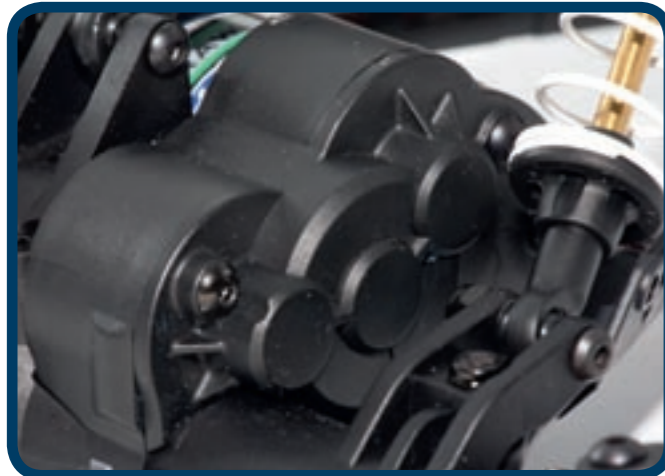
Das Getriebegehäuse der MOA-Einheit ist aus Kunststoff und sehr leicht